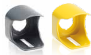
Защитный кожух для кнопки аварийной остановки