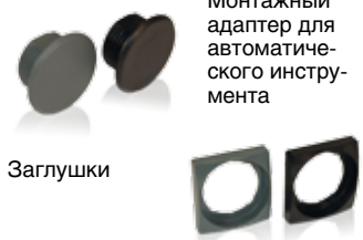
Монтажный адаптер для автоматического инструмента