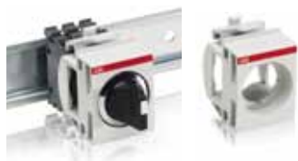
Адаптер для DIN-рейки