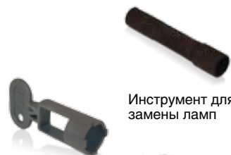
Инструмент для замены ламп