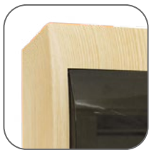
Покрытие корпуса - стойкая краска

Щиты распределительные пластиковые ЩРН-П EKF PROxima предназначены для установки модульной аппаратуры: автоматических выключателей, УЗО, таймеров, устройств управления и т. д. Используются для электромонтажа в жилых, административных, торговых помещениях. Вертикальное открывание дверцы позволяет устанавливать бокс независимо от положения соседних стен. Электрощиты изготовлены из прочного ABS-пластика.