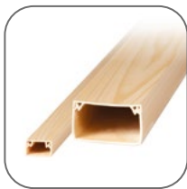
Цвет совместим с кабель-каналом EKF «дерево»