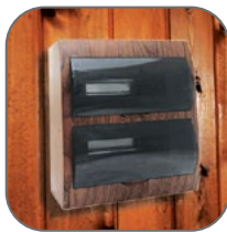
Возможность маскировки электротехнических щитов и соединений в деревянных домах