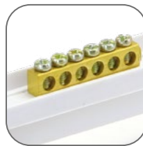
Шины N и PE в комплекте