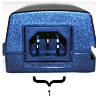
Рис. 2. Инжектор Midspan-1/190A, Midspan-1/300A Midspan-1/300G , вид сзади