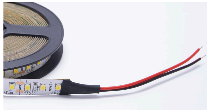
Новая комплектация: провода для подключения к блоку питания

Компания Feron заботится о покупателях светодиодной ленты 12V и упрощает способ монтажа. Теперь ленты LS606 поставляются с проводами для прямого подключения ленты к блоку питания (коннектор «мама» не входит в комплект поставки).