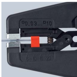
Зажимные губки из стали предотвращают проскальзывание кабеля

Запатентованная механика Глубина реза ножом для удаления изоляции автоматически соотносится с диаметром провода и тем самым с толщиной всех стандартных изоляционных материалов. Не требуется ручная регулировка, в отличие от обычного инструмента с широким диапазоном удаления изоляции.