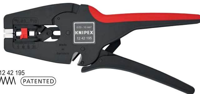
12 42 195 PATENTED