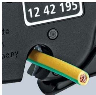
Резак для многожильного кабеля сечением до 10 мм 2