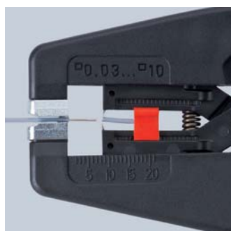
Прецизионное снятие изоляции толщиной от 0,03 до 10 мм 2 без последующей юстировки

Запатентованная механика Глубина реза ножом для удаления изоляции автоматически соотносится с диаметром провода и тем самым с толщиной всех стандартных изоляционных материалов. Не требуется ручная регулировка, в отличие от обычного инструмента с широким диапазоном удаления изоляции.