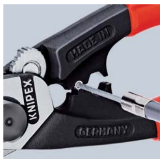
Напрессовка концевой гильзы на тяговый трос

95 62 190 T : инструмент с креплением для страховки от падения с высоты