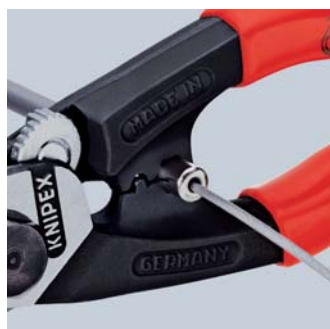
Напрессовка наконечника на боуденовский трос

Точное управление благодаря винтовому шарниру