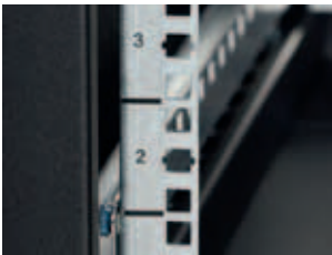
Монтажные профили имеют маркировку высоты.