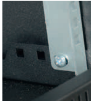
Регулировка монтажных профилей по глубине.