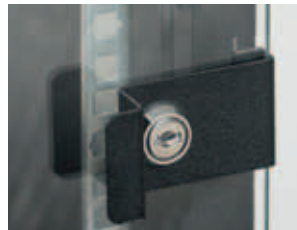
Стеклопанель имеет удобную ручку.