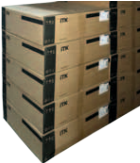
Поставка в разобранном состоянии в компактной упаковке.