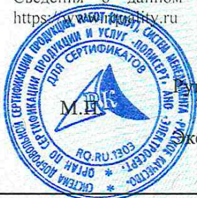
Схема сертификации 3с. Сведения о данном сертификате соответствия размещены в реестре выданных сертификатов на сайте https://certif.ru