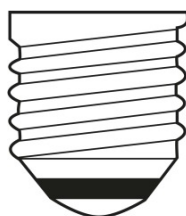
E27 IEC 7004-21