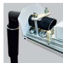
Узел крепления к кронштейну